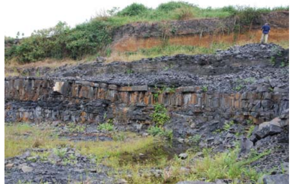
Site fossilifère gabonais près de Franceville, où ont été découverts dans des sédiments vieux de 2,1 milliards d'années, des macrofossiles centimétriques.