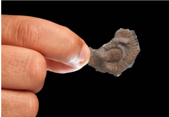
Macrofossile multicellulaire complexe et organisé trouvé au Gabon.